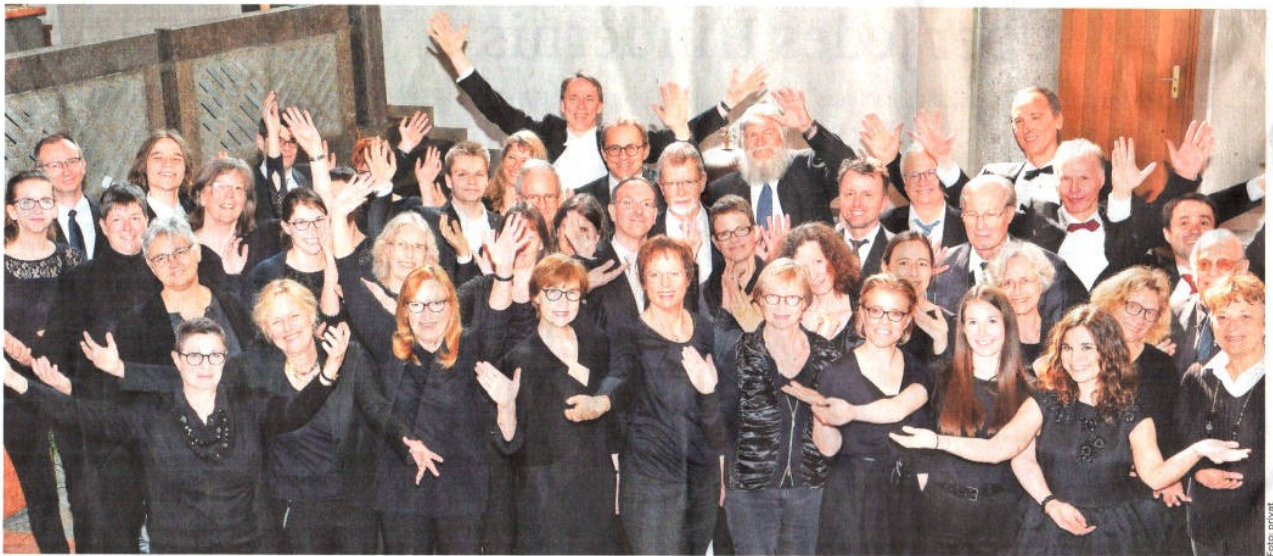
Bestenfalls auch nach 75 Jahren: Das Erlanger Kammerorchester präsentiert sich gut gelaunt in seiner heutigen personellen Zusammensetzung.