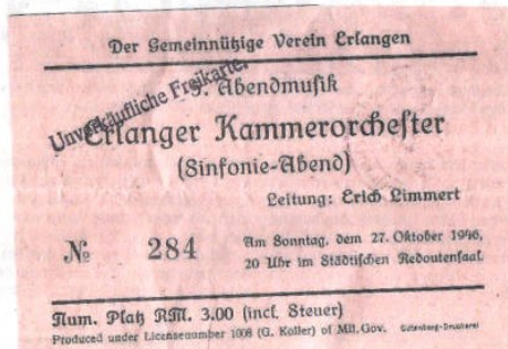
Im Oktober 1946 war das Erlanger Kammerorchester mit einem Sinfonie-Abend zu Gast im „Städtischen Redoutensaal“.

Sehr interessant sind auch die Berichte über Konzertreisen unter anderem in die Erlanger Partnerstädte Rennes, Eskilstuna und Wladimir, bei denen die Musiker durchaus