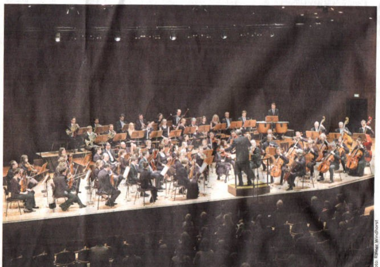
Auch offen für anderes: Das Erlanger Kammerorchester präsentierte im März 2015 in der Ladeschule gemeinsam mit Schülern der Erlanger Musikschulen und Gymnasien das Jugendkonzert „Wenn der Vater mit dem Sohne“.